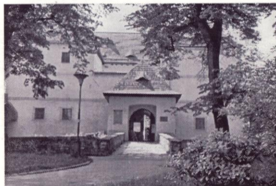
Vodní tvrz - Jeseník