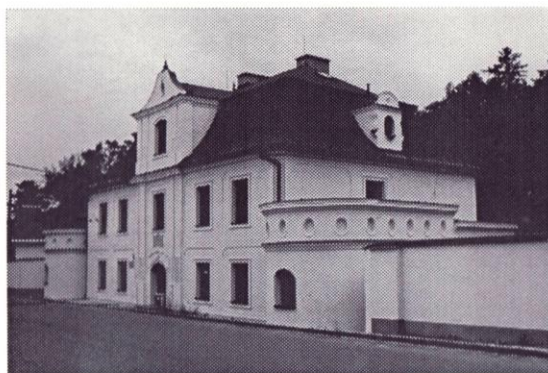
Dittersův dům - Javorník