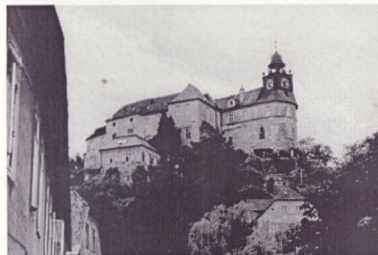
zámek Jánský Vrch - Javorník